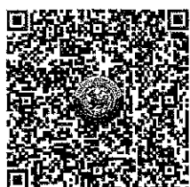
QR Code 1

ตรวจสอบจำนวนผู้ชำระค่าลงทะเบียนแต่ละรุ่น