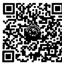
QR Code 2

ตรวจสอบจำนวนผู้ชำระค่าลงทะเบียนแต่ละรุ่น