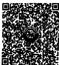
QR Code 1

ตรวจสอบจำนวนผู้ชำระค่าลงทะเบียนแต่ละรุ่น