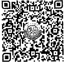
QR Code แบบสำรวจฯ

กองส่งเสริมและพัฒนาการจัดการศึกษาท้องถิ่น กลุ่มงานส่งเสริมการจัดการศึกษาท้องถิ่น โทร. ๐-๒๒๕๑-๙๐๐๐ ต่อ ๕๓๑๒ โทรสาร ๐-๒๒๕๑-๙๐๒๑-๓ ต่อ ๒๑๘ ผู้ประสานงาน : นางสาวสรลพัณณ์ พรหมสาขา ณ สกลนคร โทร. ๐๙๓-๕๓๒-๑๓๑๘