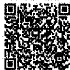
๒. โปรแกรมเทียบมาตรฐาน คุณภาพน้ำ