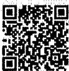
๑. รายการเครื่องมือ ทีม SEhRT